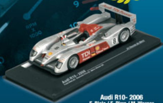
Audi R10- 2006 F. Biela / E. Pirro / M. Werner